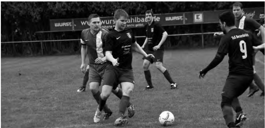
TuS Bersenbrück III gegen G.W. Schwagstorf II.